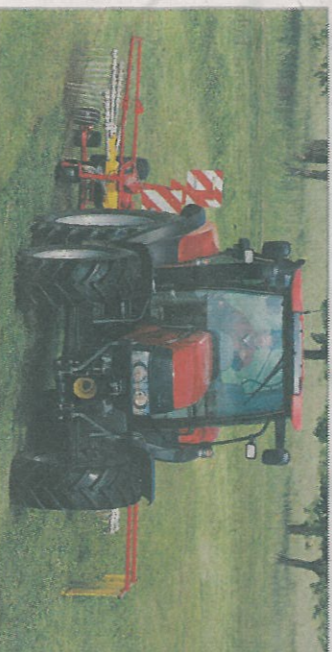
Modelová řada Maxxum nabízí řešení v podobě šesti modelů

Řada Maxxum má v nabídce také převodovku 24 × 24 pro náročnější pracovní podmínky. Všechny ovladače jsou ergonomicky rozmístěné a ty, které potřebujete používat nejčastěji, jsou v těsné blízkosti sedadla řidiče. Součástí vybavení jsou informační panely s informacemi o provozu traktoru a jeho nastavení.