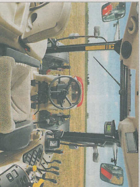
Maxxum vyniká také vysokým komfortem pro řidiče

Rok provozu zdarma zahrnuje náklady na materiál pro údržbu po 600 hodinách (filtry, olej).