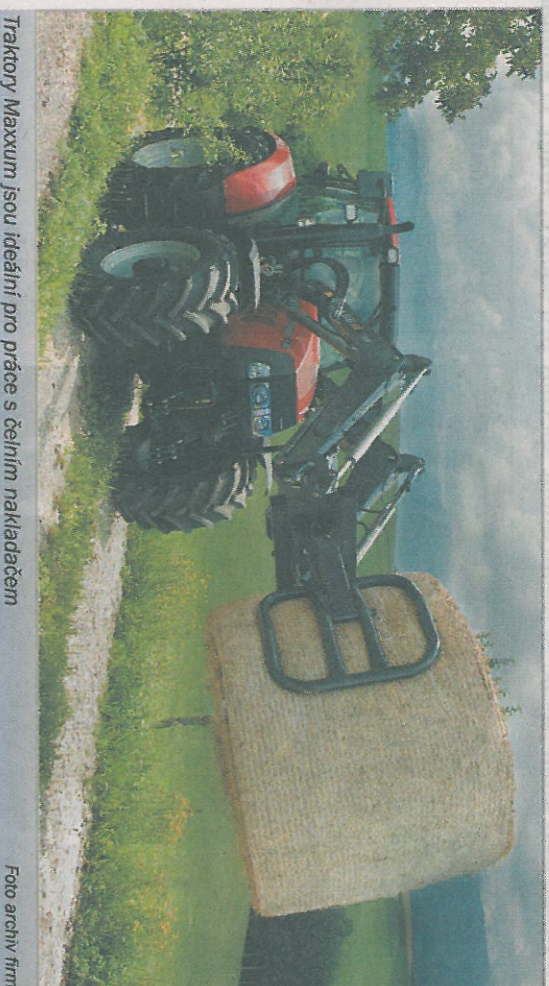
Traktory Maxxum jsou ideální pro práci s čelním nakladačem

Mimořádným přínosem mohou být vyvodové hřídele s 540/540E/1000 ot/min pro široké spektrum využití s jednoduchým ovládním a dobohovou brzdou. Operačním pomocníkem bude v mnoha situacích při práci čelní hydraulika. Samozřejmě jsou vzduchové brzdý pro bezpečnější jízdu s velkým nákladem. O redukci kmitání a stabilitu nesenyých strojů při jízdě se stará systém Hitch Ride Control, který pomocí regulací hydrauliky tlumí účinky nerovnosti. Díky kompaktním rozměrům se může traktor Maxxum pochutíbit skvělým poloměrem